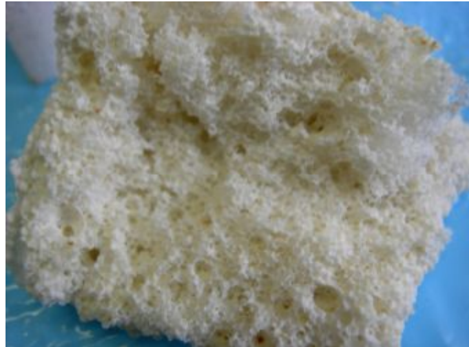
Рис. 1. Розроблений носій каталізатору на основі високоглиноземного цементу

мають високі характеристики міцності, є пористими, що дозволяє використовувати як носії каталізаторів [7].